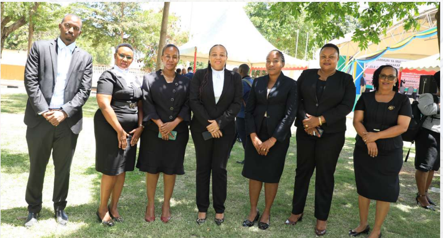
Naibu Wakili Mkuu wa Serikali (aliesimama katikati) akiwa katika picha ya pamoja na watumishi wa Ofisi ya Wakili Mkuu wa Serikali katika maadhimisho ya wiki ya Sheria Februari, 2023.