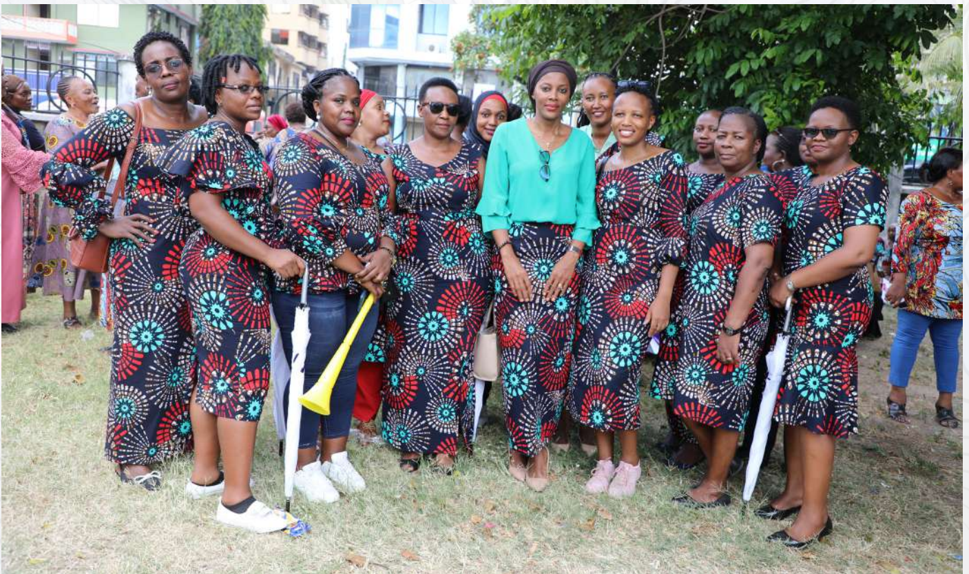
Baadhi ya Wanawake wa Ofisi ya Wakili Mkuu wa Serikali wakiwa katika picha ya pamoja katika Maadhimisho ya Siku ya Wanawake Duniani, tarehe 8 Machi, 2023