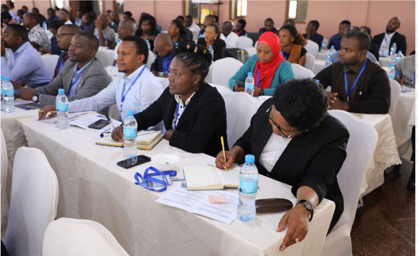
Mwakili wa Serikali wakiwa katika mafunzo ya kuwajengea uwezo yaliyofanyika jijini Arusha Juni, 2022.