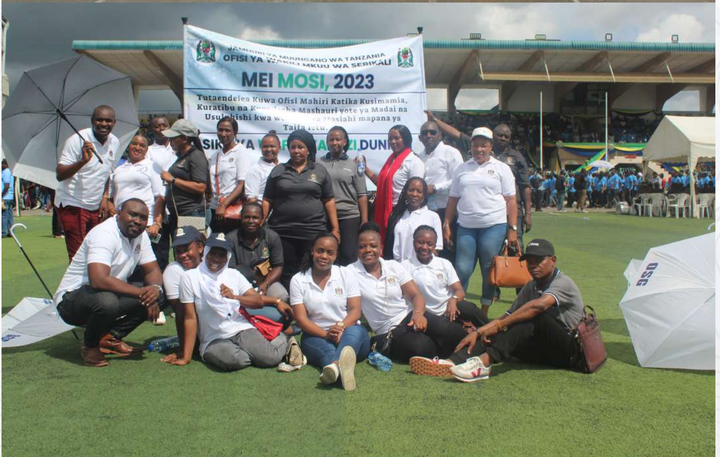
Sehemu ya Watumishi wa Ofisi ya Wakili Mkuu wa Serikali walioshiriki maadhimisho ya Mei Mosi 2023 wakiwa katika picha ya pamoja uwanja wa Uhuru Dar es Salaam