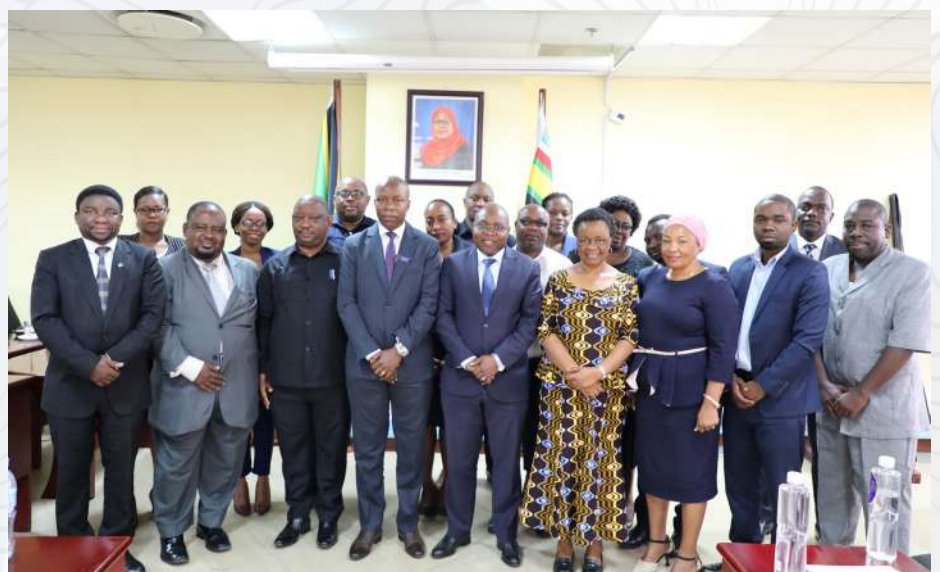
Waziri wa Katiba na Sheria Mhe. Dkt. Damas Ndumbaro akiwa na Menejimenti ya Ofisi ya Wakili Mkuu wa Serikali baada ya kikao kazi jijini Dar es Salaam Agosti, 2022.

watumishi wa kwanza walioweza kuanzisha Ofisi hii mwaka 2018. Utekelezaji wa majukumu ya Ofisi yalitanguliwa na hatua mbalimbali za kuweka sawa mifumo ikiwemo kuandaa Muundo wa Utumishi, Kuandaa Mkataba wa Wateja; Kuandaa Mpango Mkakati wa Ofisi na kuanza utaratibu wa kupata watumishi zaidi.