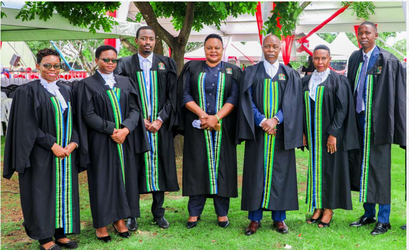
Wakili Mkuu wa Serikali akiwa katika picha ya pamoja na Mwakili wa Serikali katika maadhimisho ya Wiki ya Sheria Februari, 2022 Jijini Dodoma.