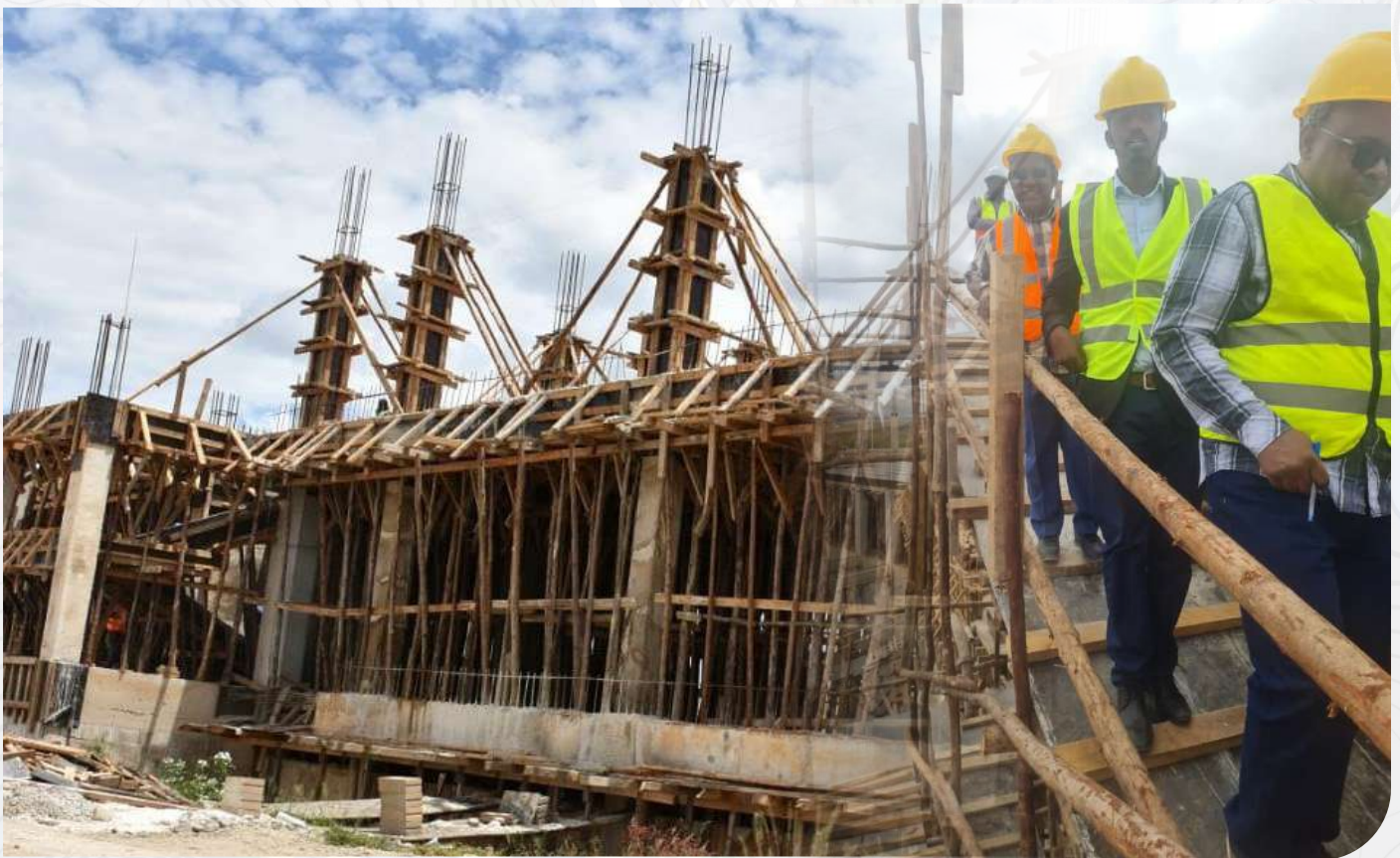
Baadhi ya Viongozi wa Ofisi ya Wakili Mkuu wa Serikali wakikagua mradi wa ujenzi wa Ofisi ya Wakili Mkuu wa Serikali unaoendelea katika Mji wa Serikali Mtumba jijini Dodoma, Mei, 2023