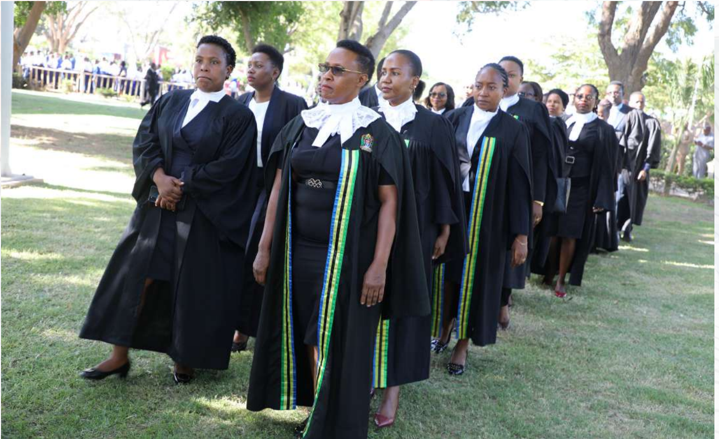
Baadhi ya Mawakili wa Serikali wakiwa viwanja vya Chinangali kwa ajili ya kushiriki kilele cha Maadhimisho ya wiki ya Sheria jijini Dodoma, February 2023.