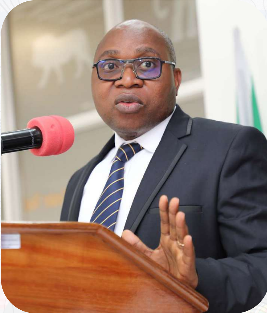
Mhe. Dkt. Damas Daniel Ndumbaro (Mb.) Waziri wa Katiba na Sheria

T angu kuanzishwa kwa Ofisi ya Wakili Mkuu wa Serikali, yapo mambo mengi makubwa ambayo yametekelezwa kwa ufanisi na Ofisi hii. Miongoni mwa mambo hayo ni pamoja na kuisaidia Serikali katika kupunguza gharama za uendeshaji wa mashauri ya madai na usuluhishi ndani na nje ya nchi. Serikali kupitia Ofisi hii, imeweza kutumia Mawakili wake katika kuendesha Mashauri yote kwenye mabaraza ya Kimataifa, ikiwemo Baraza la Kimataifa la Usuluhishi wa Migogoro ya Uwekezaji ( International Centre for Settlement of Investment Disputes - ICSID ); Mahakama ya Kimataifa ya Usuluhishi wa Migogoro ya London ( London Court of International Arbitration ) Mahakama ya kudumu ya Usuluhishi ( The Permanent Court of Arbitration- PCA ) na Kituo cha Kimataifa cha Biashara ( International Chamber of Commerce - ICC ).