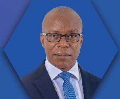
DKT. BONIPHACE N. LUHENDE

Naibu Wakili Mkuu wa Serikali Septemba, 2019 - Julai, 2020